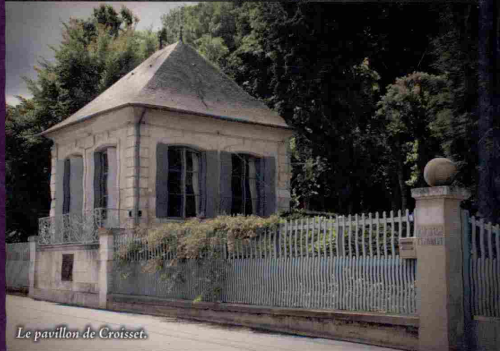
Le pavillon de Croisset.