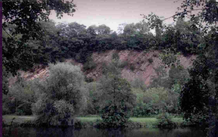
Les falaises de grès rouge à Saint-Rémy-sur-Orne.