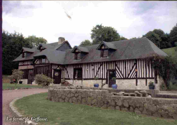
La ferme de Geffosse.